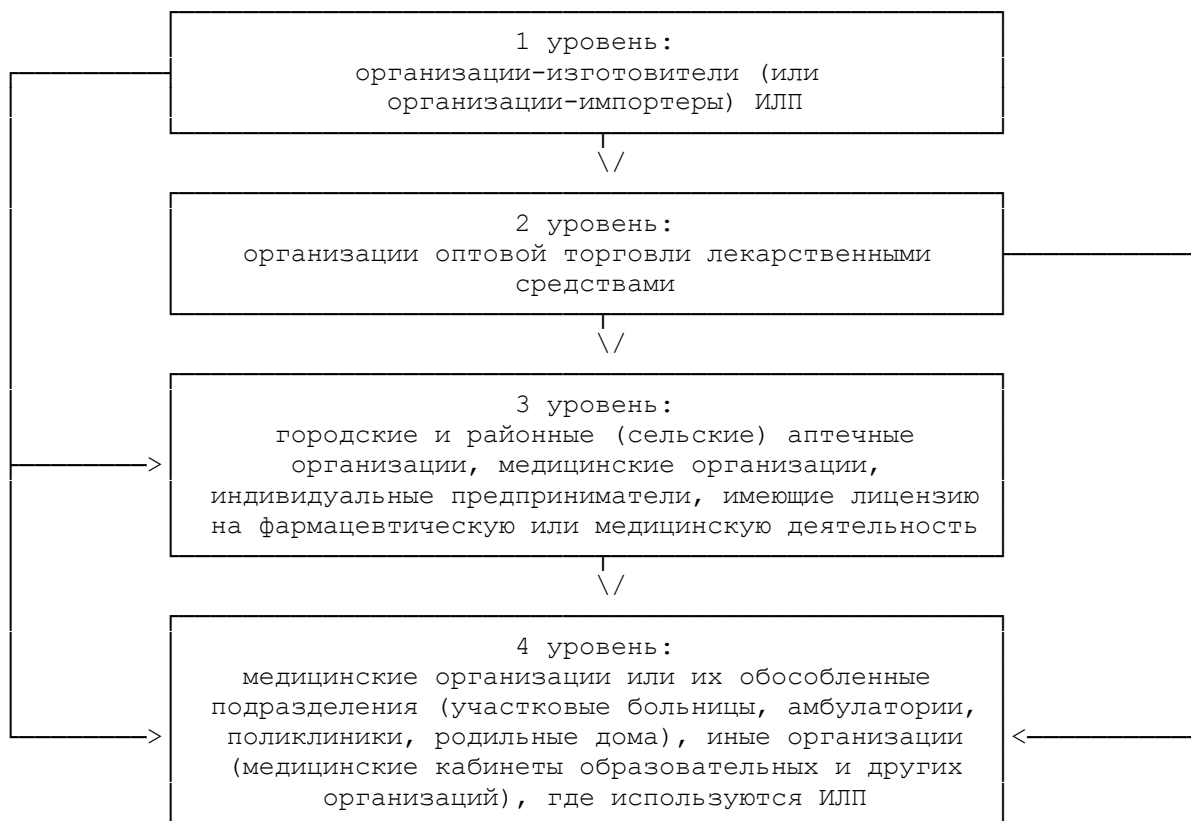
СХЕМА УРОВНЕЙ "ХОЛОДОВОЙ ЦЕПИ"